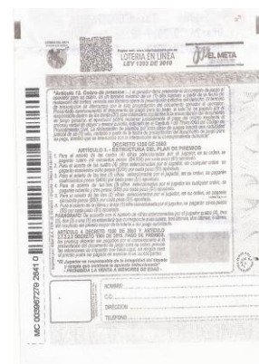
IMAGEN FORMULARIO TIPO PAPEL TÉRMICO (Anverso y Reverso) IMAGEN FORMULARIO TIPO PAPEL BOND (Anverso y Reverso)