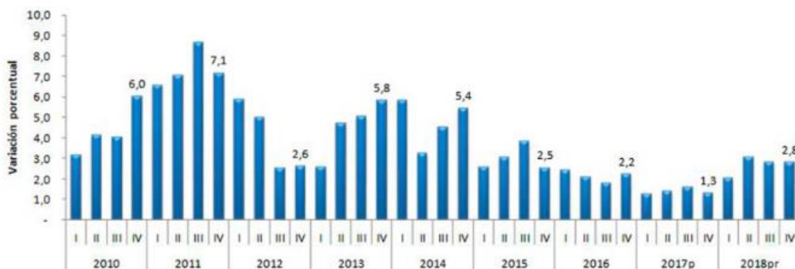
Gráfico 1. Producto Interno Bruto (PIB) Tasas de crecimiento en volumen 1 2010-I – 2018 pr -IV

Como en otros sectores de la economía deben tenerse en cuenta los indicadores como son: