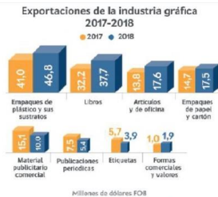
Gráfica 1.

2018 fue un año volátil en la tendencia de las exportaciones, siendo mayo con 14.1 millones de dólares y agosto con 13.8 millones de dólares, los meses con mayor crecimiento con respecto al año anterior, los productos mas destacados fueron: formas comerciales y valores el cual tuvo un crecimiento de 82.9%, artículos escolares y de oficina con 27.2%, y empaques de papel y cartón con 19%. Por otro lado, productos como material publicitario y comercial, etiquetas y publicaciones periódicas tuvieron una caída significativa en las exportaciones. (Ver gráfica 1)